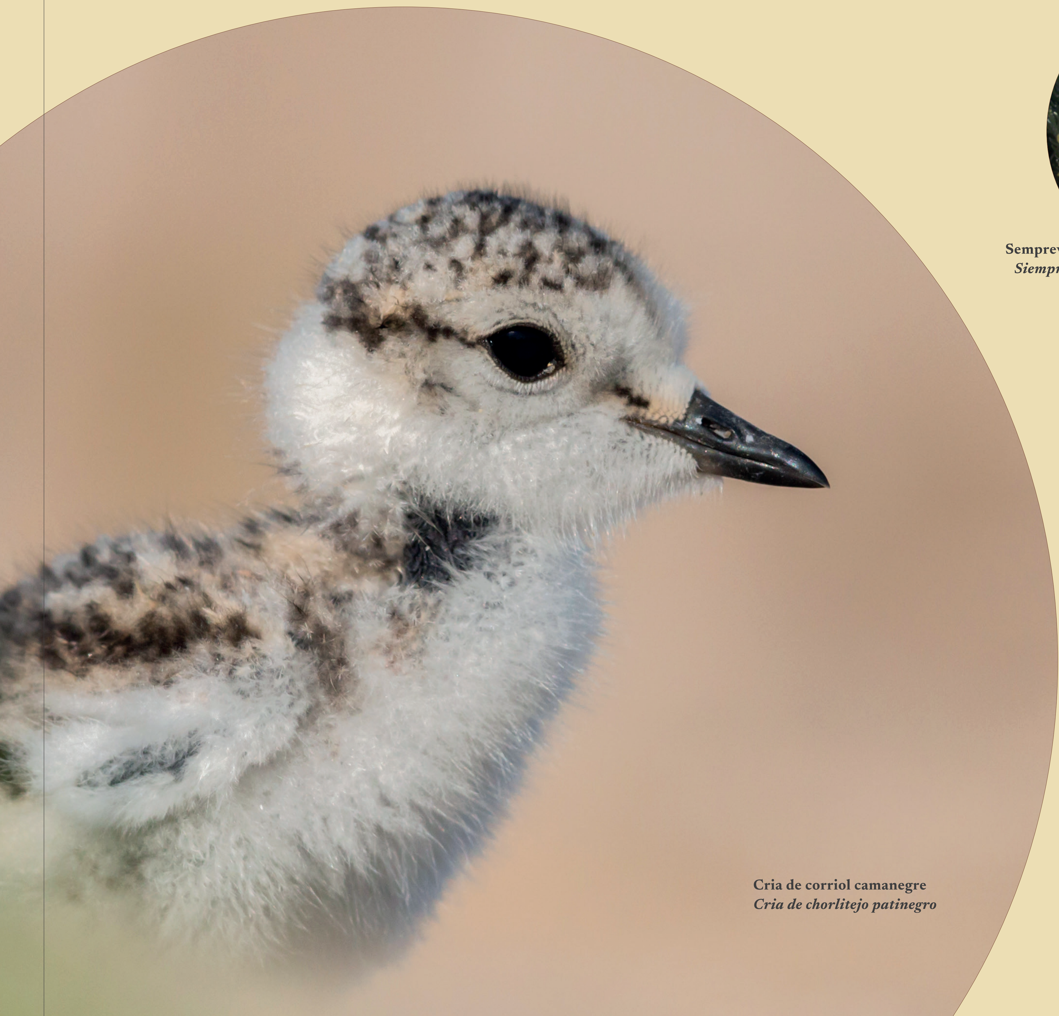
Cria de corriol camanegre Cria de chorlitejo patinegro

Las dunas de Guardamar de la Safor son un ecosistema protegido de importancia europea, que acoge animales y plantas únicos