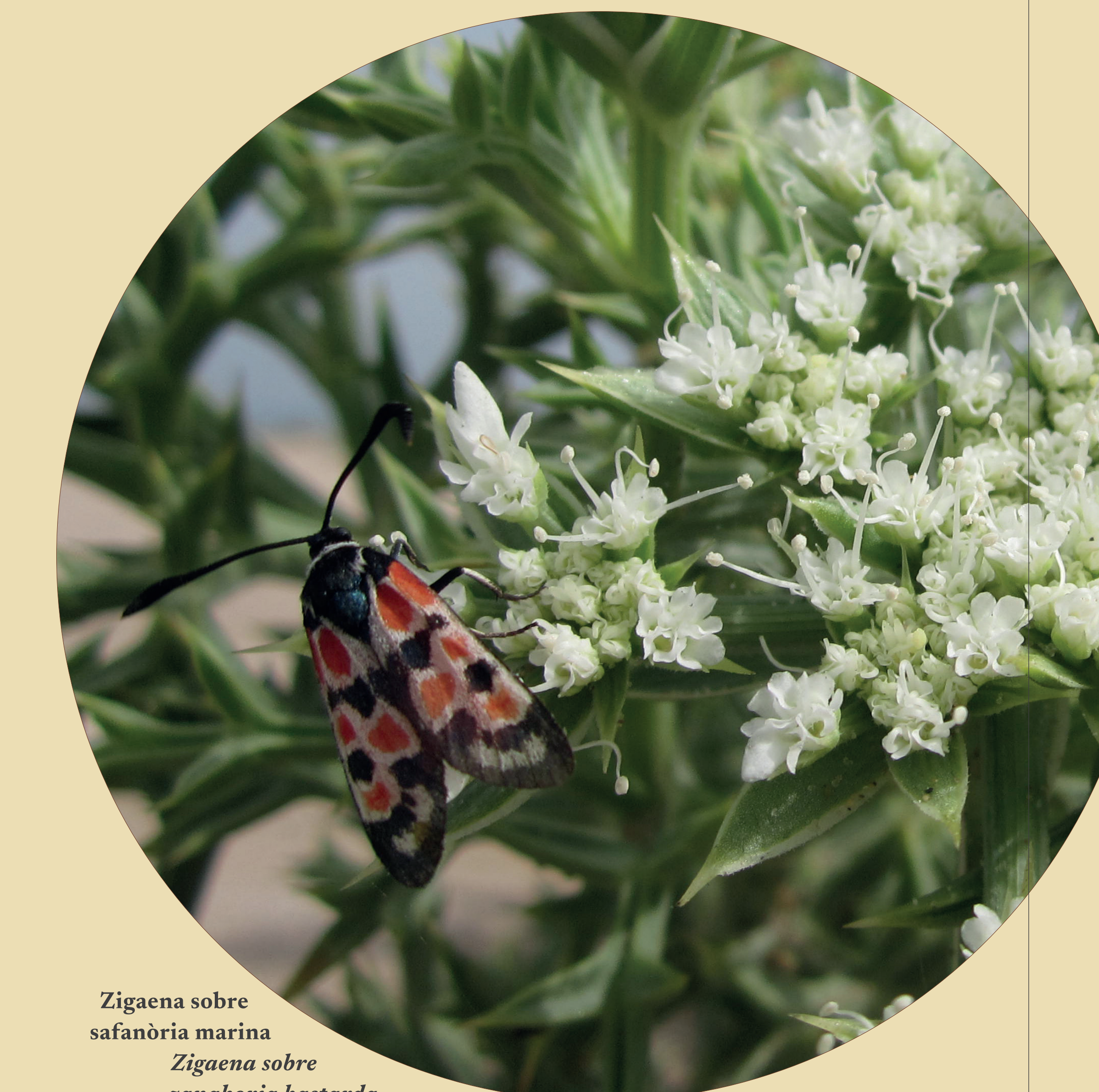
Zigaena sobre safanòria marina Zigaena sobre zanahoria bastarda

El Parc de Sant Vicent és la casa d'ocells, insectes, esquirols, sargantanes i peixos. El Parque de Sant Vicent es la casa de aves, insectos, ardillas, lagartijas y peces.