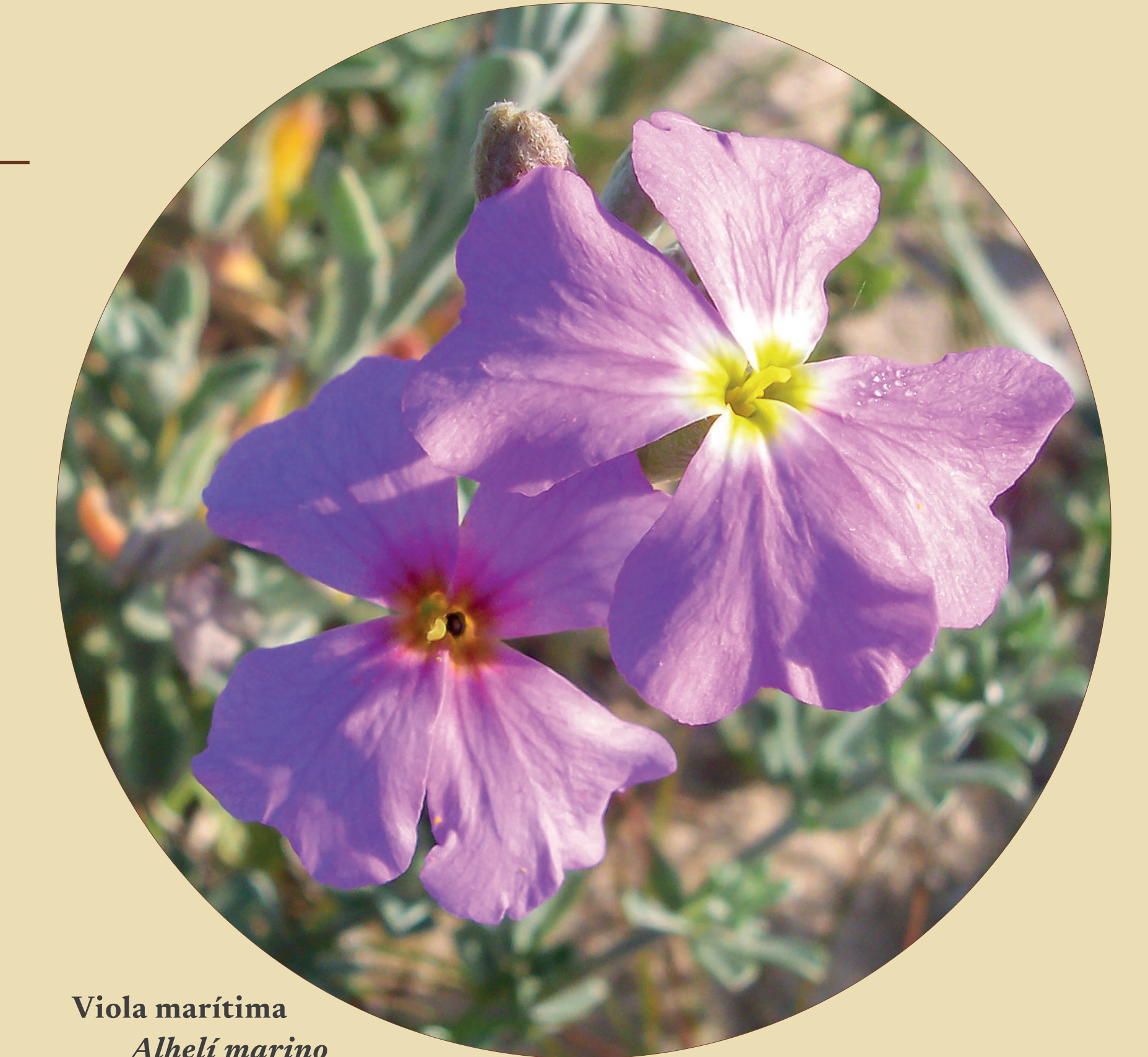
Viola marítima Alhelí marino